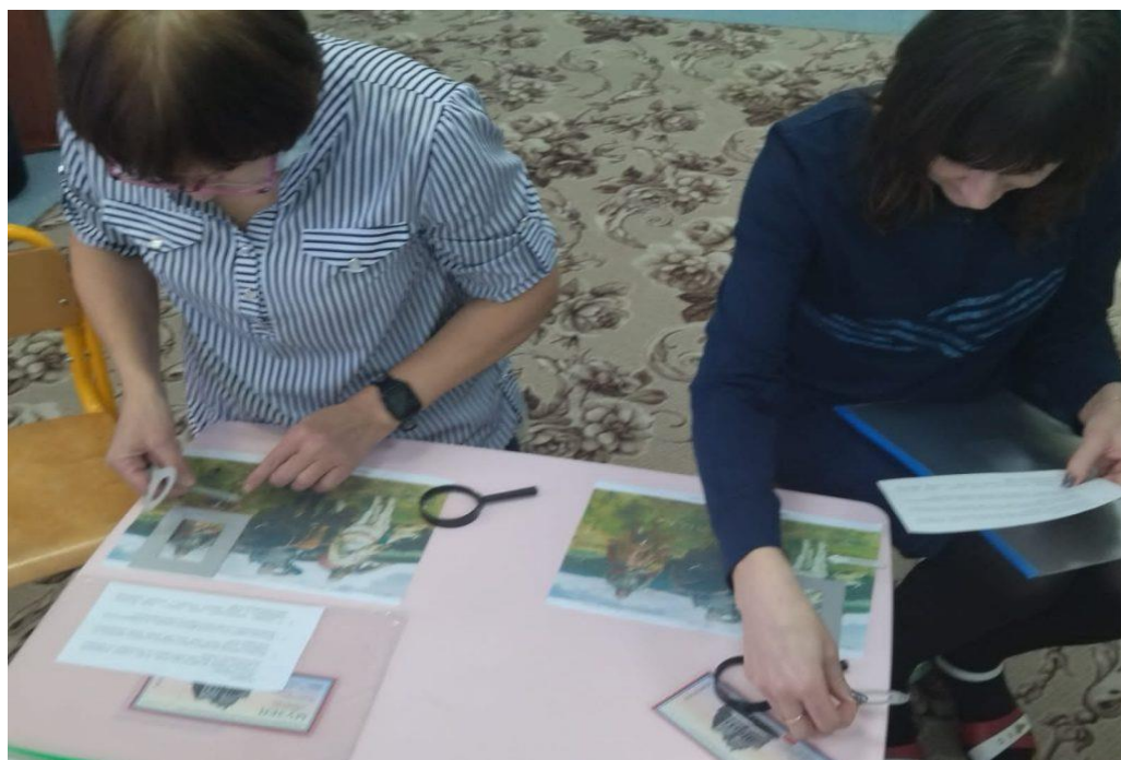
Практическое занятие с педагогами.

Для многих педагогов района семинар стал полезным. В ходе дискуссии, которая развернулась в конце семинара, многие заинтересовались данными приемами работы, отметили актуальность применения в своей работе.