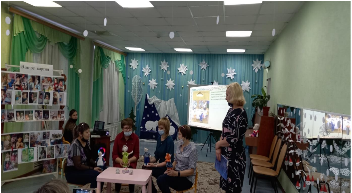
Педагоги примерили роли сказочных персонажей.